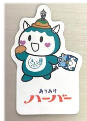
限定の「ふじキュン♡マグネット」